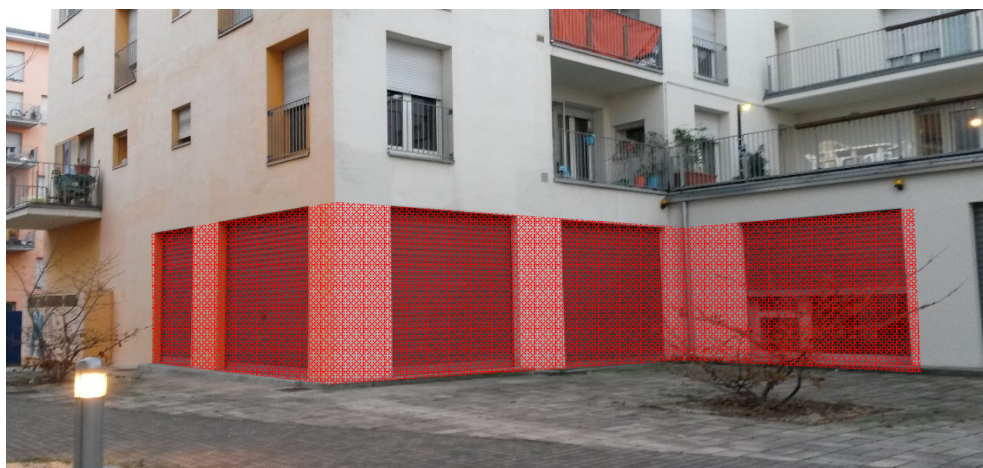
Foto da Interno Cortile con indicazione serrande locale